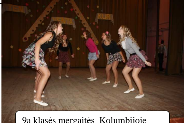
9a klasės mergaitės Kolumbijoje