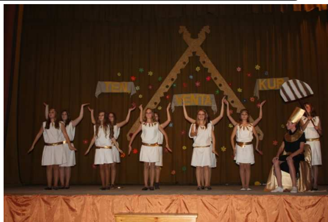
7b klasė - Egipte