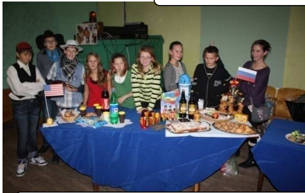
6b klasės mokinukai, atstovavę Rusiją, vaišino, vaidino, šoko...