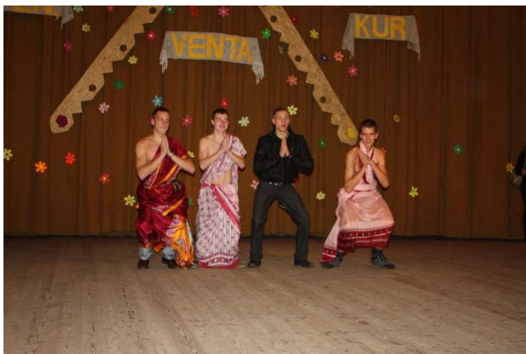
II klasės mokiniai, nukeliavo į Indiją