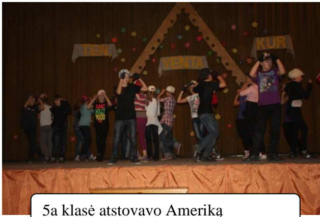
5a klasė atstovavo Ameriką